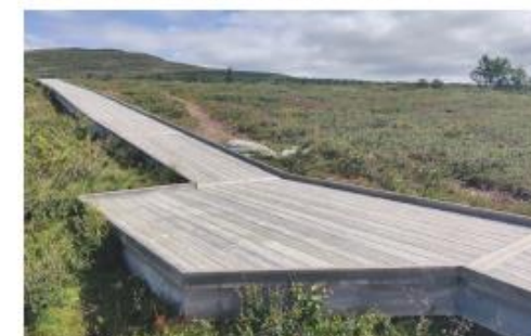
Mötesplats för passage över spången.