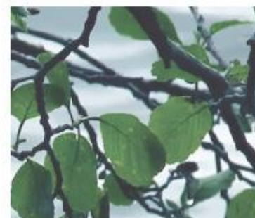
Klibbal, Lämpliga som solitär i fuktzonen