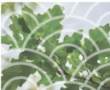
Skogsek, Lämpliga som solitär