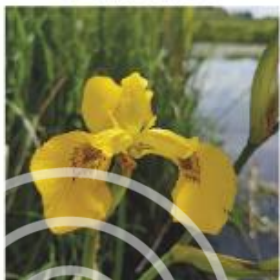
MAJ - JUNI