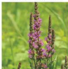
JULI - AUGUSTI

Principillustration över hur en våtmarkshylla kan anläggas i våtmarkens sumpzon med varierande blomningstid.