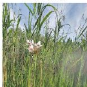
JUNI - AUGUSTI