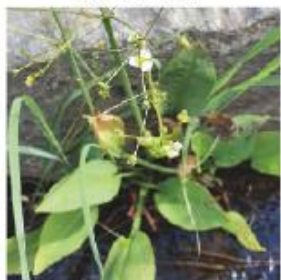
JUNI - SEPTEMBER