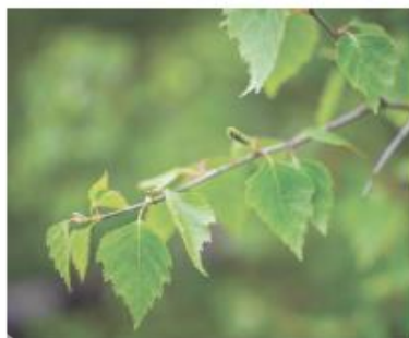
Glasbjörk, Lämpliga som solitär i